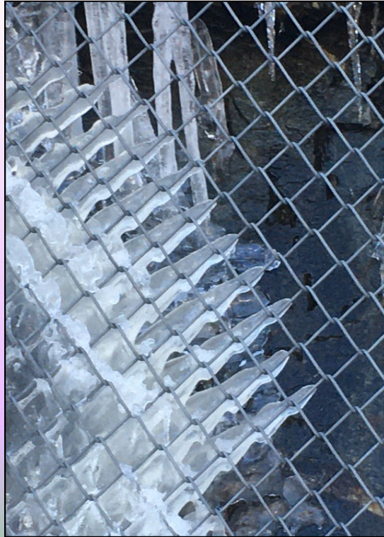
Felsvernetzung im Winter

Es können ab sofort Vorschläge für Beiträge zu den genannten Themenkreisen eingereicht werden. Das Tagungsprogramm wird aus den eingereichten Themenvorschlägen ausgewählt und zusammengestellt.